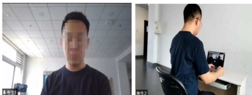
图 2 “双机位”镜头显示的考生画面