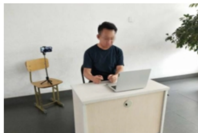
图 1 考生“双机位”设备摆放布置示意图